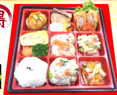
(写真は令和2年12月弁当)