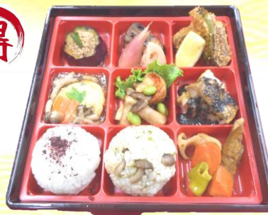
(写真は令和2年10月弁当)