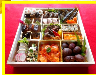
※写真は昨年の玉手箱になります。